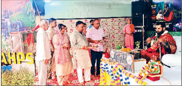
महेन्द्रगढ़। कथा के दौरान रसपान करते कथावाचक।