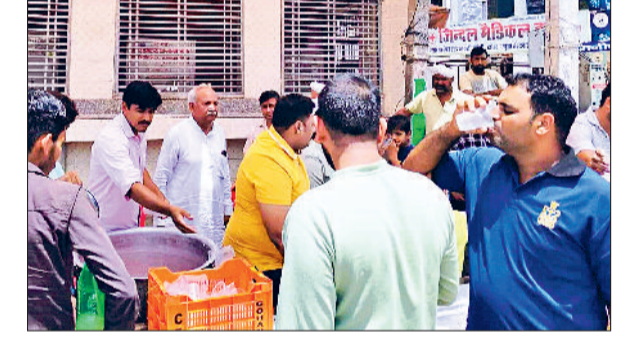
महेन्द्रगढ़। मीठा पानी पीते राहगीर।

जिससे पानी का भी सही इस्तेमाल होता है और पैदावार भी अच्छी होती है। उन्होंने किसानों की समस्याओं भी सुनी और अधिकतर समस्याओं का मौके पर ही निपटारा किया। महासभा में कृषि विज्ञान केंद्र से आए अधिकारियों ने बताया कि किसानों को फसलों में नैनो यूरिया व डीएफ का प्रयोग सही मात्रा में करने की पूरी जानकारी दी।