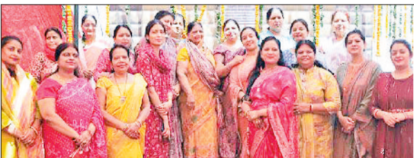
नारनौल। शीतल जल कुटीर वाटर हट का शुभारंभ करते हुए।