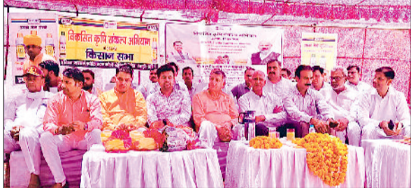
महेन्द्रगढ़। कार्यक्रम में उपस्थित सांसद व विधायक।