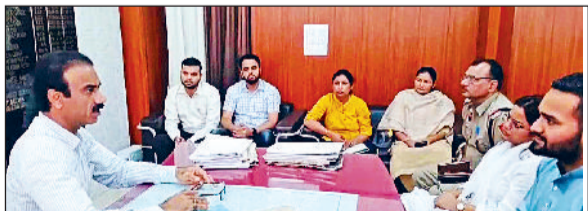
महेन्द्रगढ़। अधिकारियों की बैठक लेते एसडीएम।