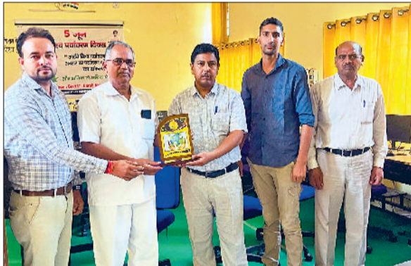
मंडी अटेली। जन जागरूकता में मुख्य अतिथि को सम्मानित किया गया।