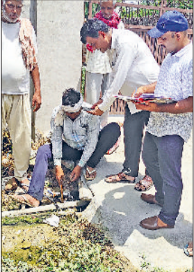
रोकने और हर घर तक पेयजल की पहुंच सुनिश्चित करने के लिए विभाग द्वारा जन जागरूकता अभियान चलाया जा रहा है, जिसके