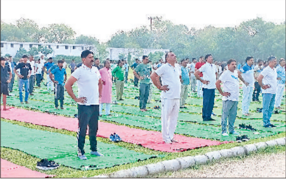
नारनौल। पुलिस लाइन में योग करते हुए।

पुलिस विभाग की ओर से शुक्रवार को पुलिस लाइन में पुलिस अधिकारियों और कर्मचारियों के लिए एक विशेष योग शिविर का आयोजन किया गया। इस शिविर का मुख्य उद्देश्य पुलिस कर्मियों को स्वस्थ जीवन शैली अपनाने और मानसिक व शारीरिक स्वास्थ्य को बेहतर बनाने के लिए प्रेरित करना था।