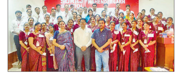
महेन्द्रगढ़। कार्यक्रम में उपस्थित विद्यालय स्टाफ।