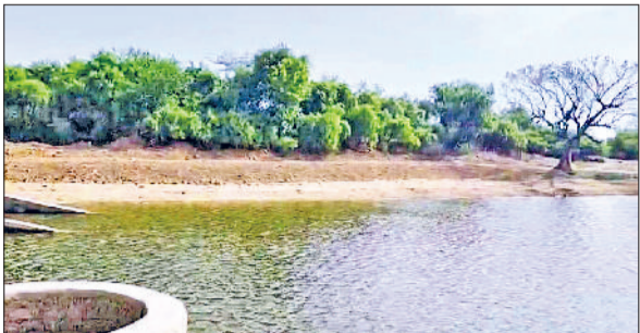
महेन्द्रगढ़। गांव जेरपुर का महाभारतकालीन जोहड़।

जिले के गांव बखरीजा, बांयल, नांगल दार्ग, धौलेड़ा, गोलवा, मूसनौता, पंचनौता, ढाणी रावता, बोगोपुर, गांवड़ी जाट, ऊष्मापुर, राजावास, गढी, डिगरोता मुकंदपुरा, दौखरा, सरली, निजामपुर रोपड़ सराय आदि में ट्रेक्टर-ट्राली में सफाई का कार्य कराया जाएगा। जिला पुलिस को माइनिंग एवं क्रेशर जोन में सीसीटीवी कैमरे एवं पुलिस बृथ बनाने में भी सहयोग किया जाएगा, जिससे अवैध माइनिंग पर रोक लगाने में सहयोग मिलेगा। इसके साथ-साथ सभी सात क्रेशर जोन में धूल एवं मिट्टी को रोकने के लिए