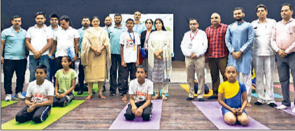
महेंद्रगढ़। बच्चों को सम्मानित करते हुए।